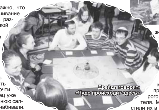
Дрейдл говорит: «Чудо происходит здесь»

местечка. Когда читаешь Шолом Алейхема, то у него к иронии, достаточно острой, добавляется такой более мягкий, где-то даже с любовью, юмор. А в 20-м веке, просто-напросто, в связи с тем, что