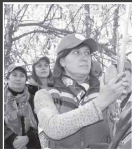
Обратим лулав во все стороны света

Прожить в шалаше неделю, то есть исполнить заповедь Суккота «от и до» – задача невероятно трудная для казахстанских евреев. Дело даже не в погоде. В Кустанае, Петропавловске, Павлодаре в начале октября на стылом ветру озябнешь и простынешь. Не сомневайтесь, Творцу такие жертвы не нужны. Какой Ему в том смысл? Но заповедь есть заповедь; и во всех общинах в обязательном порядке взрослые и дети, семьи и молодежь находят возможность возвести сукку, провести в ней обряд арба-миним и как следует повеселиться. Известно, одно из названий Суккота – праздник урожая.