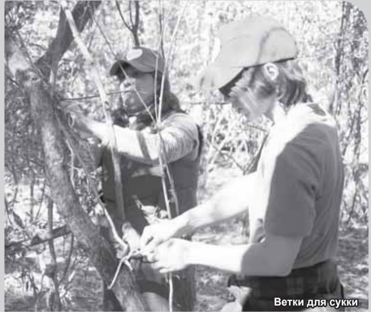
Ветки для сукки

Наслаждением стали праздничная трапеза и игры. Разгадывали загадки, веселились в играх «Изобрази профессию», «Кто быстрее выпьет воду из детской бутылочки», «Накорми с завязанными глазами партнера кашей», «Пронеси яйцо в ложку», а ещё были бег в мешках, бег в парах и другие развлечения. Причём наши бабушки в играх на свежем воздухе ни в чем не уступили молодым.