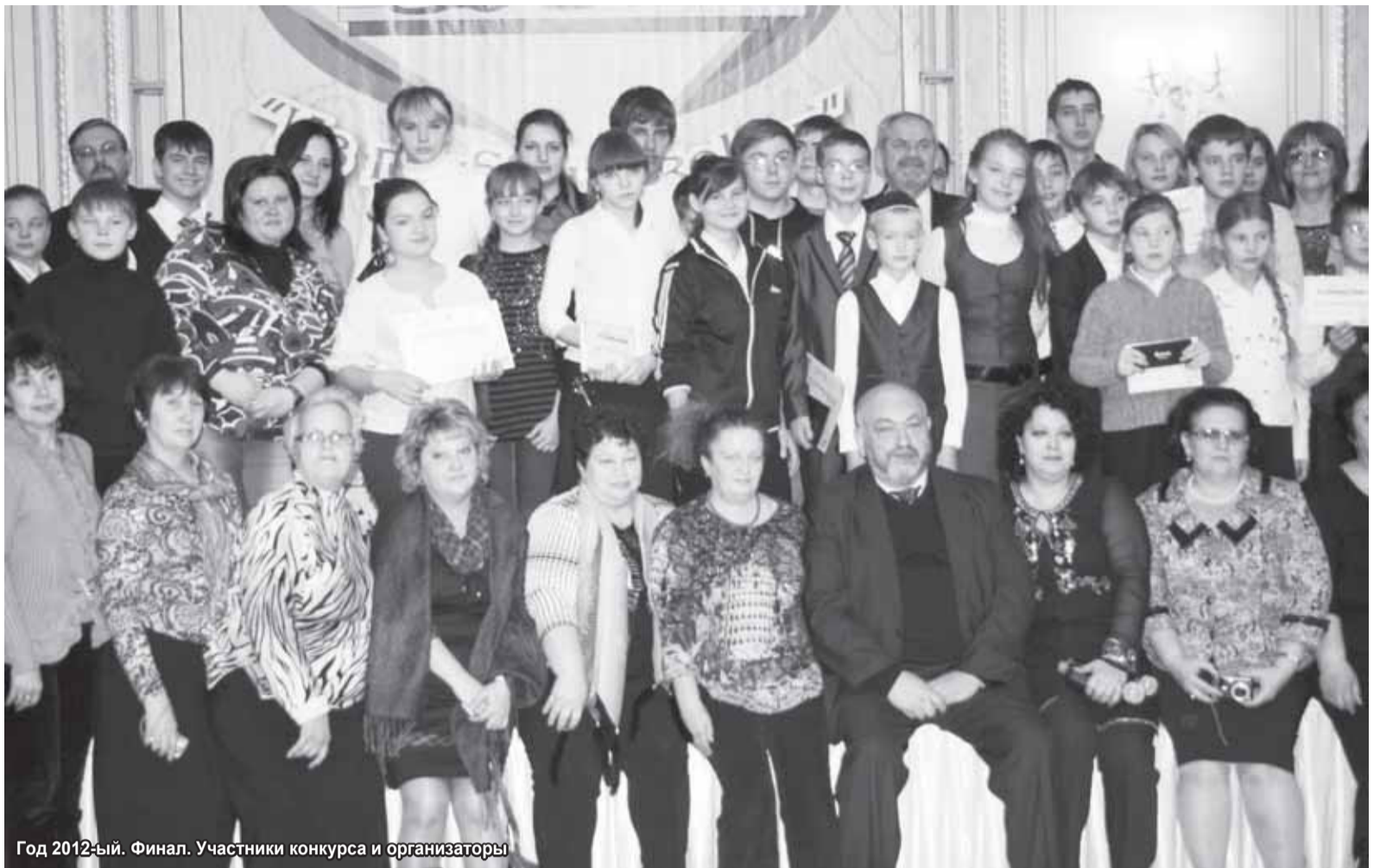
Год 2012-ый. Финал. Участники конкурса и организаторы

— Ну, вы свою точку зрения отстаивали перед жюри конкурса — хорошо поработали. Поздравляю!