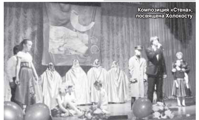
Композиция «Стена», посвящена Холокосту

Другая трагическая страница нашей истории: XX век, Вторая мировая война, Бабий Яр под Киевом,