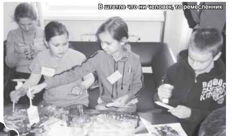
В штетле что ни человек, то ремесленник

Главная идея нашего выездного семейного лагеря на все 4 дня – это то, как проходит Ханука в местечке. Мы решили отойти от стандарта, что каждое торжество у нас рассказывают историю праздника, что произошло тысячелетия назад в Израиле, когда он возник, что в свя-